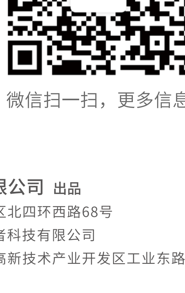
微信扫一扫, 更多信息